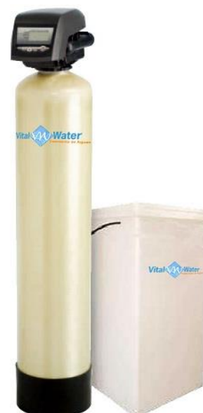
Medidas Vista Frente