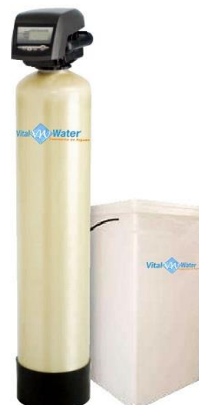
Medidas Vista Frente